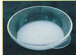
デトックス後の色で頭皮の老廃物と髪の毛に付着した汚れをチェック