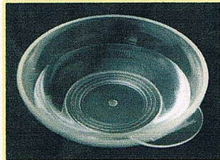
最初は無色透明です

毎日のシャンプーだけでは落としきれない毛穴の奥の汚れや老廃物を当店でデトックス(解毒)してみませんか？デトックスされたエッセンスの色で頭皮環境をチェックしてみましょう。美しい髪はまず地肌のケアが重要です。